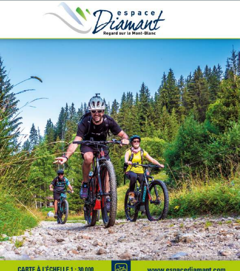
CARTE À L'ÉCHELLE 1 : 30 000 www.espacediamant.com